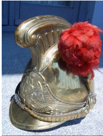
Coif de pompieri militari, model 1862