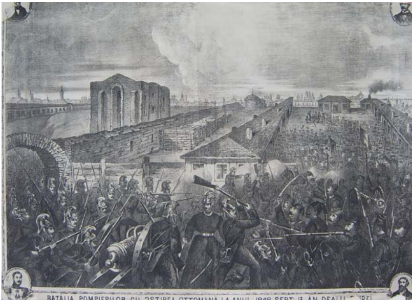
Scenă din Lupta din Dealul Spirii (Dimitrie Papazoglu)