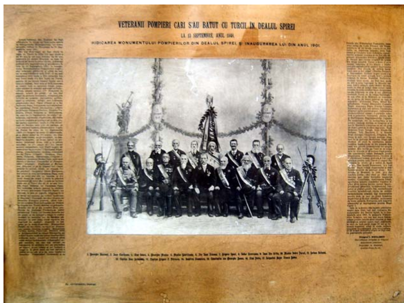
Veteranii pompieri la dezvelirea Monumentului Eroilor Pompieri