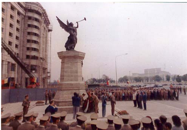
Redezvelirea Monumentului, la 13 septembrie 1990